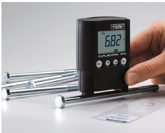
测量铁上镀锌层的厚度，测量小曲率工件必须进行校准以获得准确的测量结果