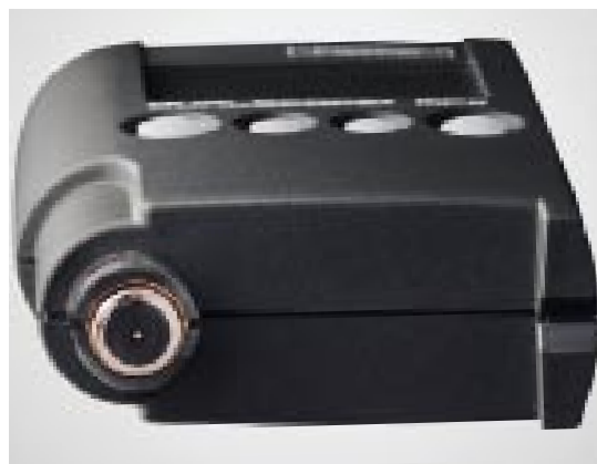
表面有硬质镀层的内置探头，底座和探头处配以V型凹槽，可测量圆柱形工件。