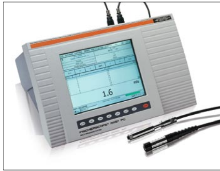
FISCHERSCOPE® MMS® PC, 通用测量平台系统, 可采用磁感应、电涡流和β背散射法进行涂镀层厚度测量和常见材料测试