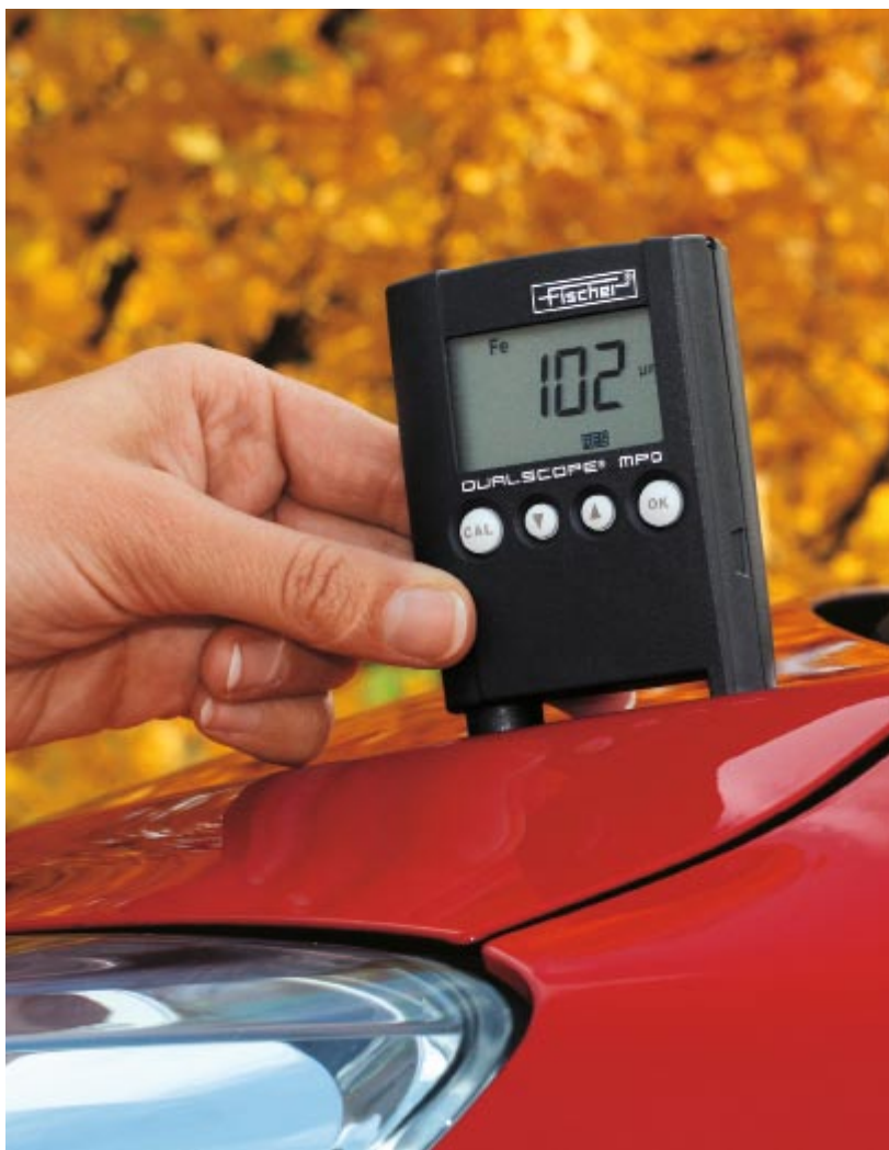
使用DUALSCOPE MPO检测油漆厚度，例如：汽车车身

新款DUALSCOPE®MPO采用广受认可的Fischer探头技术，是最为小巧并能最大程度满足您测量需要的仪器。它测量精度高、界面友好且结实耐用。对不复杂工件的现场测量尤为理想。内置探头，采用磁感应及电涡流方法，可快速无损地测量涂镀层厚度。DUALSCOPE®MPO自动识别基材例如铁或铝并选择适合的测量方法。可显示最重要的统计参数。由于有着出色的重复精度及统一标准的校准功能，使得这款仪器在同级别产品中无与伦比。