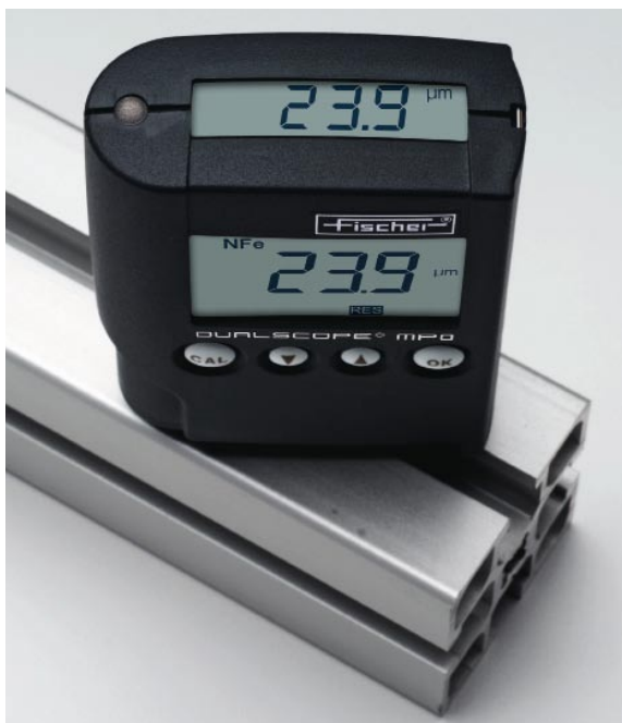
测量铝上阳极氧化膜的厚度