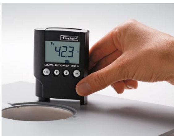
测量铁上油漆的厚度