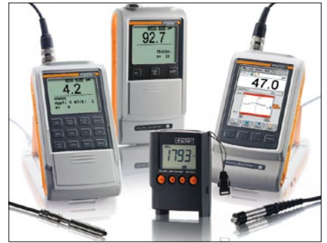
ISOSCOPE®, DELTASCOPE® and DUALSCOPE® 手提式仪器, 配有内置探头或外置独立探头, 可在现场快速简便测量涂镀层厚度

本宣传册中的信息包含了一般化的描述或性能特点, 可能并不适合所有已描述的具体应用, 或是由于产品更新会有更改。这些性能特征只有在合同中表述才具有约束力。DELTASCOPE®, ISOSCOPE®, DUALSCOPE®, FISCHERSCOPE®, FERITSCOPE®, MMS® and XDAL® 是德国Helmut Fischer GmbH Institut für Elektronik und Messtechnik的注册商标。